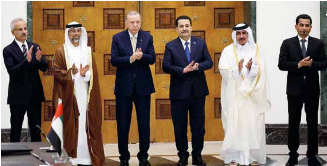
Kalkınma Yolu Projesi için Türkiye, Irak, Katar ve Birleşik Arap Emirlikleri (BAE) arasında mutabakat zaptı Cumhurbaşkanı Recep Tayyip Erdoğan ve Irak Başbakanı Muhammed Şiya es-Sudani'nin himayesinde imzalandı.

FAV Limanı'ndan yola çıkarak Avrupa'ya gidecek bir geminin Kalkınma Yolu'nu kullanmasının Süveyş Kanalı'na kıyasla 15 günlük kazanım sağlayacağını belirten Bakan Uraloğlu, bu projenin bölgesel ticaret açısından yeni bir kapı aralayacağını aktardı. Bakan Uraloğlu, Kalkınma Yolu Projesi'nin sadece uygun maliyetli ve kısa mesafenin yanında mevcut ulaşım koridorlarının tamamlayıcısı olduğunu kaydederek, "Böylece, doğu batı yönündeki koridorları kuzey güney yönünde bağlamış oluyor. Global ticaret sistemine doğrudan