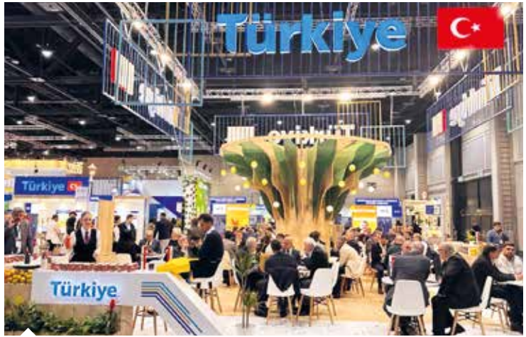
Akdeniz İhracatçı Birlikleri, her yıl 6 uluslararası fuarın millî katılım organizasyonunu yürütüyor.

ciroların ve kârlılıkların artmasını sağlıyor. Marka bilinirliklerini ve itibarlarını artırmalarına yardımcı oluyor. UR-GE projelerimiz, firmaların yeni ürün ve hizmetler geliştirip inovasyon yapmalarına katkıda bulunarak rekabetçiliği de artırıyor.” dedi.