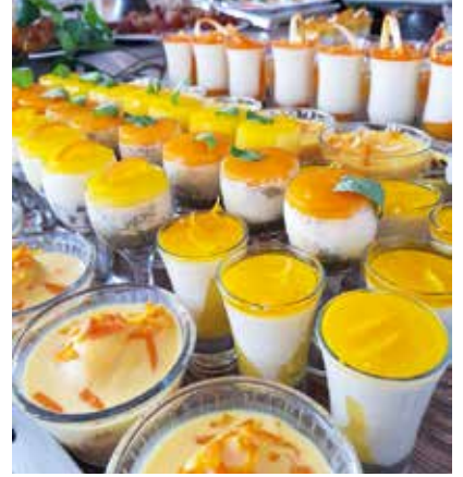
Portakallı Lezzetler Yarışması'na katılan şefler tatlı, pasta, soğuk-sıcak yemekler ve yöresel Adana mutfağı ile portakal birleştirdi.