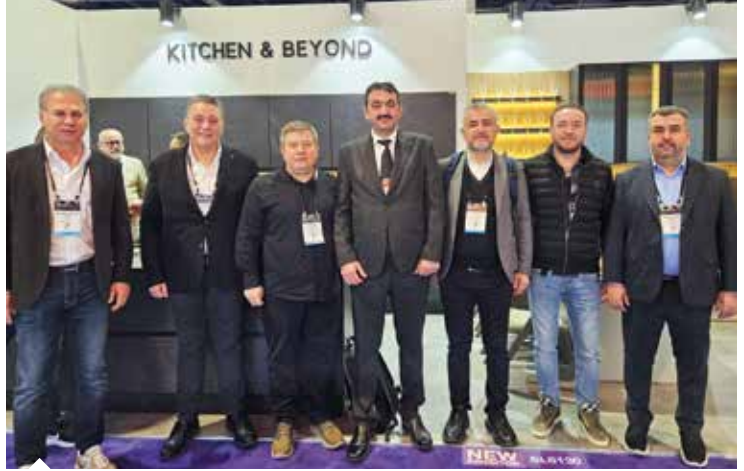
Akdenizli ihracatçılar, Türk mutfak ve banyo ürünlerinin yeni pazarlara girişi ile global markalaşma için önemli bir platform olan Las Vegas KBIS Uluslararası Mutfak ve Banyo Fuarı'nda tanıtımlar yaptı.