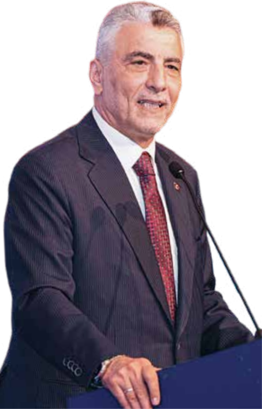
◀ Ticaret Bakanı Ömer Bolat, "Mal ve hizmet ihracatı için desteğimizi 2024 yılında yaklaşık iki kat artışla 21,5 milyar liraya çıkararak ihracatçılarımızın kullanımına tahsis ediyoruz." dedi.

Ticaret Bakanlığı olarak ihracatı en yüksek düzeyde gerçekleştirme gayreti içinde olduklarını vurgulayan Bakan Bolat, daha çok üretmek ve daha yüksek katma değerli ihracat yaparak ülkeyi daha ileriye götüreceklerini sözlerine ekledi.