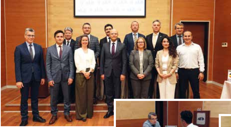
AKİB üyeleri, ticaret müşavirlerinden Rusya, Hindistan, Çin, Malezya, Macaristan, İran, Almanya ve Ürdün pazarlarının güncel durumu hakkında bilgi aldı.

Türkiye'nin ihracat hedeflerine ulaşması için 4 yıl ticaret müşaviri olarak Rusya, Hindistan, Çin, Malezya, Macaristan, İran, Ürdün ve Almanya'da görev yaptıktan sonra yurda dönen Ticaret Bakanlığı bürokratları, AKİB hizmet binasında düzenlenen etkinlikte görev yaptıkları ülkelerde edindikleri deneyimleri Akdenizli ihracatçılarla paylaştı.