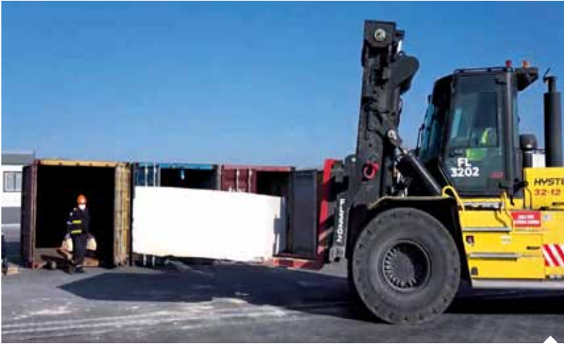
MIP, 3 tondan 45 tona kadar kaldırma kapasiteli ekipman parkı ile mermer taşımalarını gerçekleştiriyor.

2023 yılında yaklaşık 2 milyon TEU konteyner, 8 milyon tonun üzerinde konvansiyonel yük elleçleyen Mersin Uluslararası Liman İşletmeciliği (MIP), yeni kara terminalinde doğal taş yüklerine özel depolama alanıyla mermerde 700 konteyner iç dolum kapasitesine ulaştı. 3 tondan 45 tona kadar kaldırma kapasiteli ekipman parkı ve DBA sertifikalı kantarlara sahip MIP, ihracatçıların ihtiyaçlarına özel çözümler sunuyor.